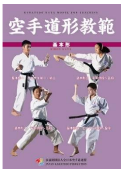
『空手道形教範 基本形』 (定価 税込4,400円、送料別)