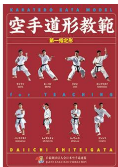
『空手道形教範 第一指定形』 (定価 税込3,740円、送料別)

※参考：審判員のコメントで、「第5挙動の立ち方が…」等、形の動作を挙動数で説明していることがあります。挙動数は、全日本空手道連盟『空手道形教範』をご参照ください。